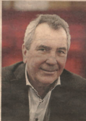
ANTOG UTMANINGEN. Jens Spendrup, ordförande i Svenskt Näringsliv.

"Han kommer från Djurs- holm. Jag har själv bott i för-